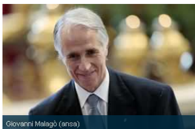
Giovanni Malagò